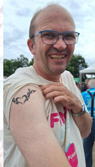
Wilco heeft een tattoo