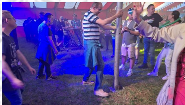
Wilco aan het paaldansen