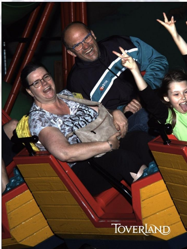
Zelfs Wilco is in een achtbaan geweest